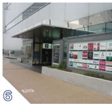
⑥ 右手のソニックシティビル出入口から入ります。