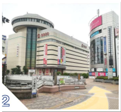
② 西口 に出ると歩行者デッキを進みます。

J R大宮駅西口 歩行者デッキにて直結 徒歩 3 分です。 市民ホール・会議室・展示場は ビル内 にあります。 大ホール・小ホール・国際会議室は ホール内 にあります。