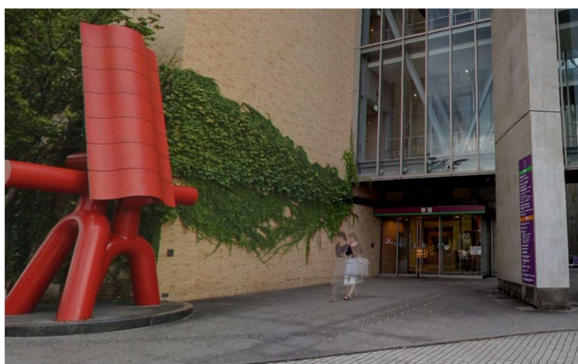
建物北側にある京都テルサ・東館入口